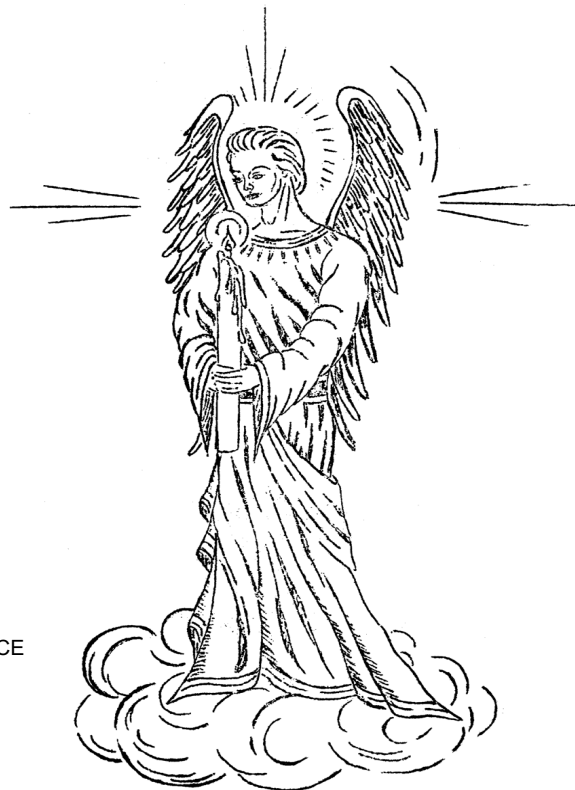
Immagine: IL PORTATORE DI LUCE

Ogni serata SFERE DI LUCE al MFK è frequentata da 12-15 persone. A queste serate partecipano gruppi molto specifici e appositamente preparati. Un ritratto a grandezza naturale di un angelo chiamato "IL PORTATORE DI LUCE" adorna la sala di preghiera. Questo ritratto è stato creato con GUARIGIONE MENTALE e si può vedere sulla copertina del primo libretto Menetekel.