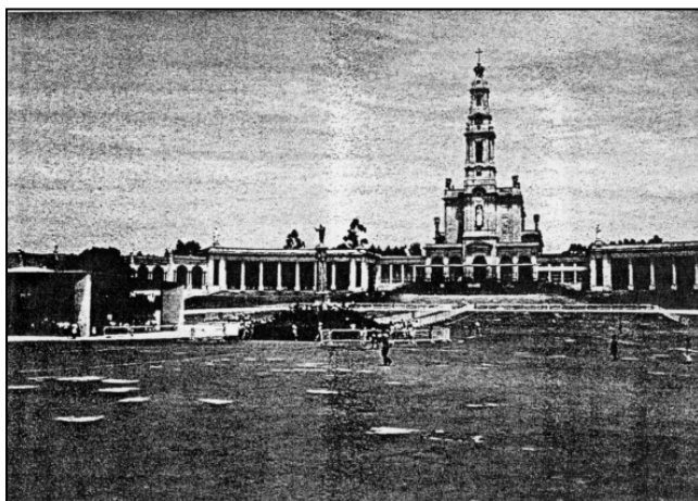
Immagine 6: Piazza dei pellegrini con la basilica e la cappella dell'apparizione.