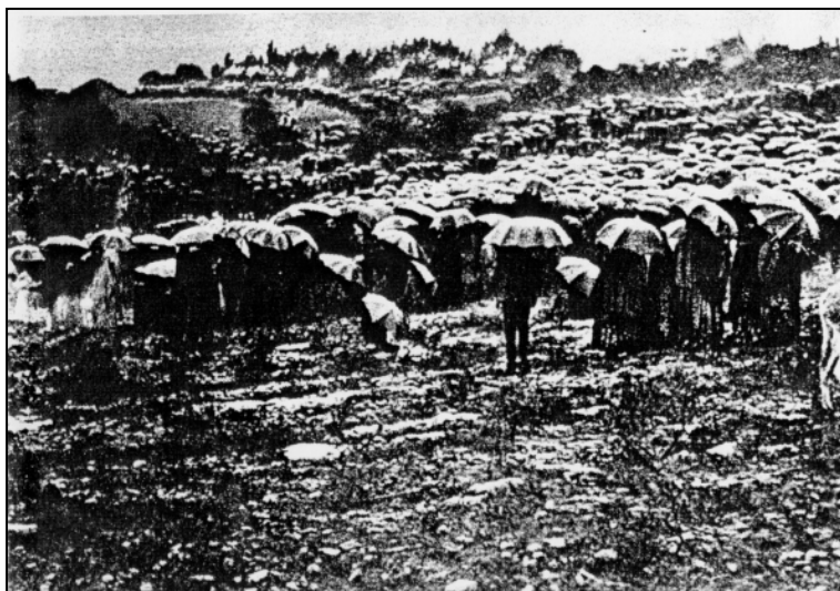
Immagine 3: La folla alla Cova da Iria il 13 ottobre 1917. (Fatima Edition.)

“Il 13 ottobre 1917, circa 70.000 persone si recarono in pellegrinaggio alla Cova da Iria. Sotto i loro passi, il terreno inzuppato si era presto trasformato in un pantano. I principali quotidiani avevano inviato i loro migliori reporter”. (Immagine 3)