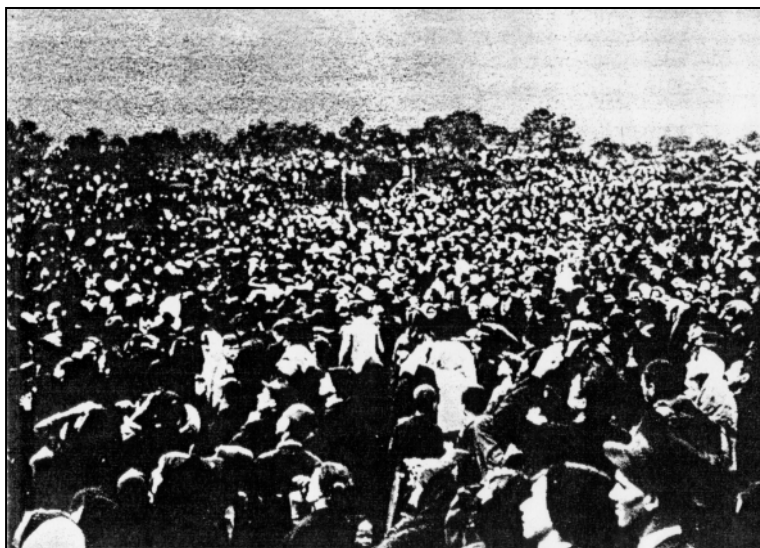
Immagine 4: La folla che guarda il cielo durante il miracolo del sole sulla Cova da Iria. (Fatima-Edition.)

Osservazione: Non c'è dubbio che si trattasse di un UFO. La descrizione del fenomeno corrisponde esattamente a tutte le esperienze precedenti. L'unica cosa importante è che questo fenomeno UFO è stato supportato da messaggi.