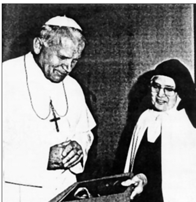
Immagine 7: Papa Giovanni Paolo II e suor Lucia durante la visita a Fatima il 13 maggio 1982.