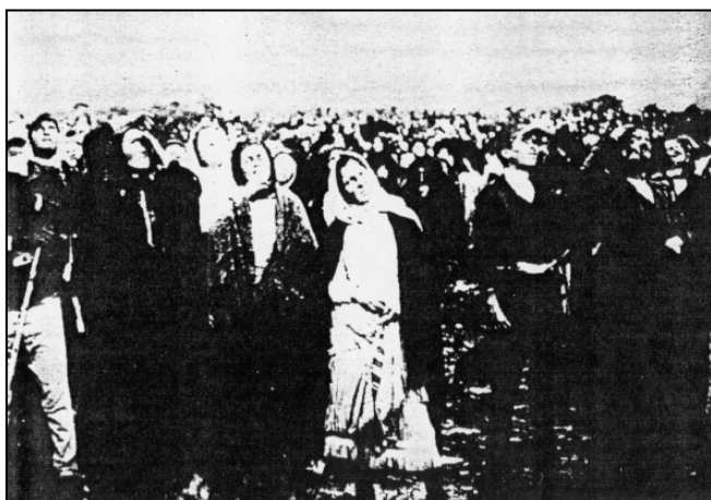
Immagine 5: Un'altra foto della gente attonita che guarda il cielo durante il “miracolo del sole” a Fatima.

Osservazione: Ogni fase del “ miracolo di Fatima ” corrisponde esattamente a migliaia di osservazioni UFO. La Chiesa cattolica aveva una conoscenza e un'idea dei viaggi spaziali extraterrestri altrettanto scarsa di quella degli israeliti sul Monte Sinai. Ma oggi è diverso. Siamo in possesso della verità.