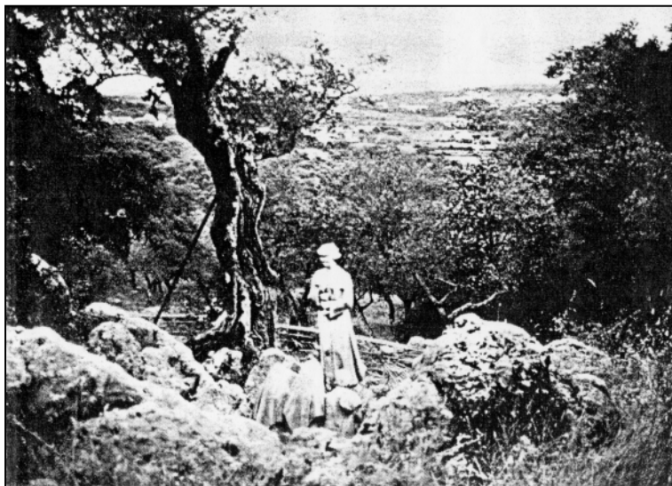
Immagine 2: Il luogo in cui apparve l'angelo, oggi decorato con un gruppo di figure.

Osservazione: Abbiamo già riferito qualche anno fa che gli UFO possono innescare fenomeni di aurora boreale.